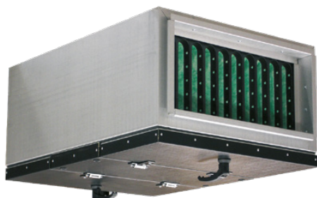
LTS 504 för undertaksmontage. Luftflöde storlek 03-04 0,20-0,80m 3 /s